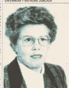
EN EL «18 DE JULIO», DONDE EJERCÍ EN LA CONSULTA DE TOCOLOGÍA, SE TRABAJABA MUCHO. ESO SÍ QUE LO RECUERDO BIEN

Completado los 84 años, pero a pesar de los años recuerda con nitidez su profesión y repasa recuerdos desde su nacimiento hasta el presente. «Yo hija y mi primer esposo viví en el barrio de San Pedro de Alcántara», dice. Ha sido enfermera y matrona en el antiguo «18 de julio» y en el Hospital de la Cruz Roja y también en la Isla Azil. Trabaja en una pequeña maternidad que se hallaba en Ciudad Jardín. Hoy, casi 60 años de trabajo y miles de momentos inolvidables y acompañados que esta mujer que hoy, distribuye ya el «18 de julio», recuerda con cariño una profesión que «nace» el 18 de julio.