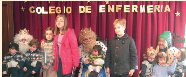
Los Reyes Magos atienden las peticiones de los niños

La visita de Sus Majestades los Reyes Magos de Oriente a la institución colegial se enmarca en una campaña más amplia de Educación para la Salud. Uno de los objetivos