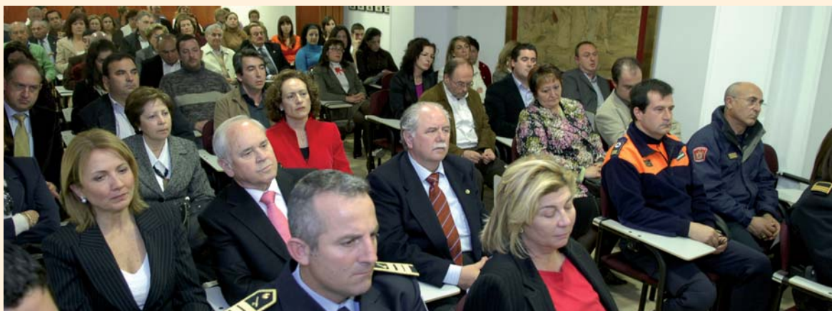
El Colegio reúne a una amplia representación de profesionales. Imagen de una celebración anterior del Día del Patrón