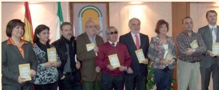
Autoridades y miembros de la Junta de Gobierno del Colegio de Enfermería, en la firma del convenio