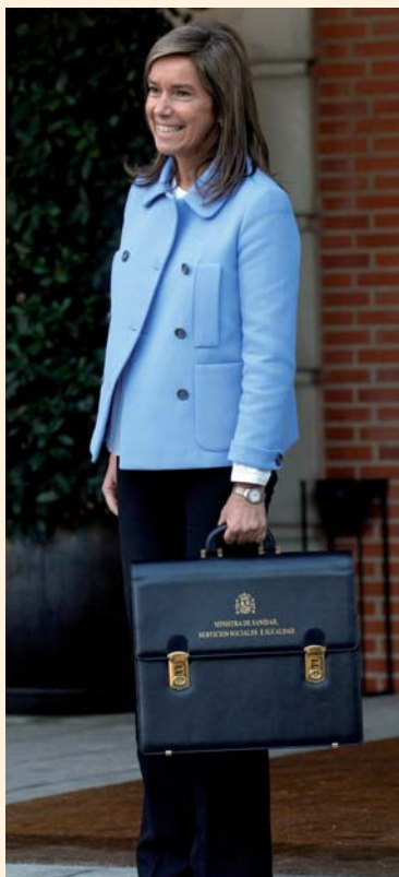
La ministra de Sanidad, Ana Mato, en su toma de posesión del cargo

“De la misma manera, quiero en nombre de la Enfermería Andaluza y de los usuarios de los Servicios Sanitarios en nuestra Comunidad Autónoma, en cumplimiento de una de las funciones estatutarias de este Organismo como es ‘la promoción de actividades que redunden en beneficio de una mejor calidad en los pa-