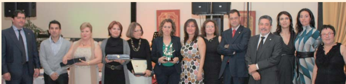
Imagen de la entrega de premios en un anterior Ciudad de Huelva