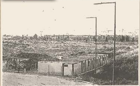
La maquinaria y las casetas de obra llevan varios días en la parcela.

especialistas y pensó que la mejor para mí sería hacer matrona. «¿Por qué? Pues, entonces, que me sentía más cómoda trabajar con mujeres y así ha sido. He atendido muchos partos y he acompañado a muchas mujeres. Debo decir que me ha gustado mi trabajo, aunque hubo una época difícil en la que había que salir pronto a la calle, era una profesión con la que he estado a gusto. «Durante cuáles tiempos? «En el 18 de julio» trabajé hasta el 1980. «¿Ahora la enfermería ha dado un cambio de 180 grados? Sí. Antes todo era diferente. Pero siempre el paciente ha estado en el centro de la enfermería. Hoy me da una impresión que me da muchos pacientes. En mi caso, como matrona, las mujeres agradecían que otra mujer les atendiera en los partos. Partos que primero eran más en casa, en la calle, que digo yo, y después, poco a poco, más en los centros de salud. «En el «18 de julio» nacieron muchos niños. Sí, desde lo que era el em-