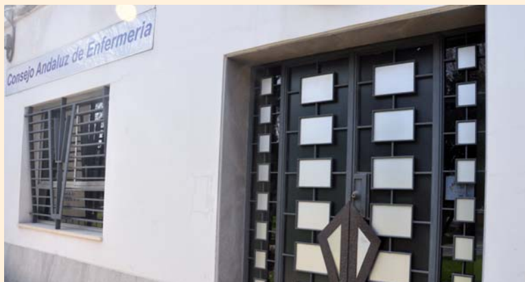
Puerta de entrada al Consejo Andaluz de Enfermería

La otra apuesta fuerte del CAE se refleja en las partidas estimadas para las coberturas sociales, más conocidas como prestaciones sociales, que están a disposición de todo colegiado y que consisten en la concesión de ayudas por el nacimiento de hijos (110 euros), por matrimonio (120 euros) y por defunción (400 euros).