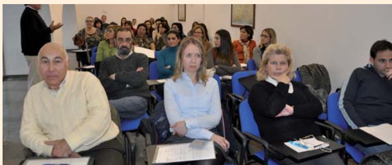
Alumnos de uno de los seis grupos durante la primera sesión del curso

En cuanto a la estructura de los cursos, los alumnos han de seguir