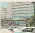
Fachada principal del Hospital Infanta Elena.

El Hospital Infanta Elena ha implantado en todo el centro hospitalario el denominado Código Ictus, un protocolo de actuación urgente que permite identificar con rapidez los casos en los que se produce un ataque cerebrovascular o ictus, y activar así con la suficiente celeridad las distintas fases y actuaciones que posibilitan prestar una atención eficaz a los pacientes afectados por esta patología, reduciendo las secuelas que puede provocar al instante el tratamiento durante las primeras horas.