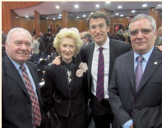
Los representantes de la enfermería española también coincidieron con el presidente de la Xunta de Galicia, Alberto Núñez Feijóo